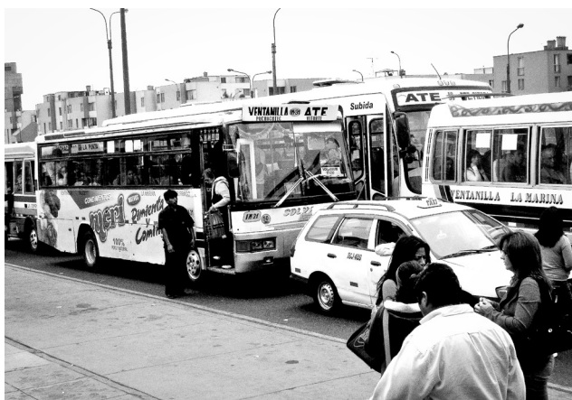
Auf Limas Straßen

In Lima gibt es keinen Fahrplan und daher ist es als Fremde gar nicht so einfach dort anzukommen, wo man ankommen möchte. Als einzige Orientierungshilfe kleben grelle Schilder mit den mir unbekanntem Fahrzielen an der Windschutzscheibe, die die aus den Bussen hängenden Menschen in unglaublicher Schnelligkeit verbalisieren. Als hätte kein Bus mein Fahrziel angefahren, verharre ich verwirrt am Straßenrand und atme Abgase ein, als ich nach Luft suche. Meine Lunge beschwert sich mit Husten. Die wild durcheinander schreienden, heißeren Stimmen zeugen von einer tranceartigen Routine. Und während die Cobradore von einem sich täglich gleichenden Dasein betäubt scheinen, versetzt mich das Extraordinäre in einen Rausch. Wir sind grundverschieden, teilen bloß für wenige Sekunden eine beinahe zu vernachlässigende Gemeinsamkeit: Wir befinden uns am Rande von Lima, irgendwo an der ewig langen Carretera Central am gleichen Ort. Während diese ihr Zuhause ist, bin ich eine Besucherin, eine Fremde. Ich bin anders. Das fühle ich, und es ist nicht schwer zu bemerken, dass das in diesem Augenblick auch jeder andere bemerkt.