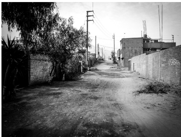
Die Straße zum Centro Vida Nueva

Immer in Cuadras , Karrees, eingeteilt, ist Lima ein gewaltiges Schachbrett, auf denen die Figuren flink agieren und oft einen harten Kampf ums Überleben führen. Sich immer gleichend und scheinbar nirgends endend, stellt mich die schachbrettartige Struktur vor ein Rätsel, das ich lösen möchte. Ich finde Gefallen an diesem chaotischen, lärmenden Moloch, der herausfordernd lächelt und gleichermaßen bedroht. Ich möchte ihn erkunden und mir seine Geschichte erzählen lassen. Ich möchte erfahren , in welche Richtungen die tausend Busse unterwegs sind; erleben, was hinter ihren Scheiben geschieht, was vor ihren Scheiben passiert; entdecken, welche Schönheiten hier versteckt sind und welche traurigen Bilder bewegen. Ich möchte die Wege gehen, die mein Reiseführer nicht kennt und mich nicht nur dort aufhalten, wo sich ein Tourist sicher fühlt. Die Straßen sind die Seele der Stadt, die umso transparenter wird, je größer die Distanz zum Zentrum ist. Um mit ihr in Kontakt zu treten, fahre ich Bus. Stundenlang. Von nun an jeden Tag!